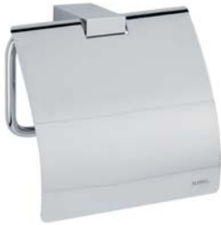
730009 Papierrollenhalter Toilet Roll Holder