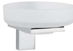
730007 Seifenhalter Soap Dish Satinirtes Glas - Iced Glass