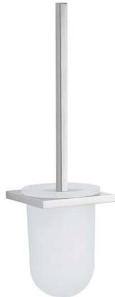
730005 WC-Bürstengarnitur Toilet Brush Holder Satinirtes Glas - Iced Glass