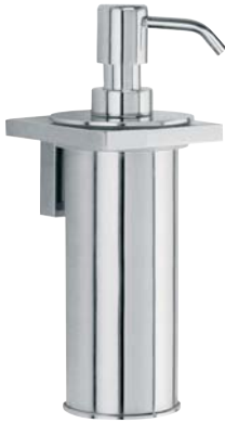
730013 Seifenspender Soap Dispenser