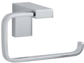
730004 Papierrollenhalter Toilet Roll Holder