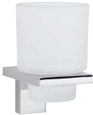
730006 Glashalter Glass Holder Satinirtes Glas - Iced Glass