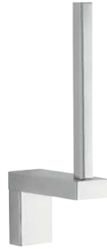
730012 Reserverollenhalter Spare Roll Holder